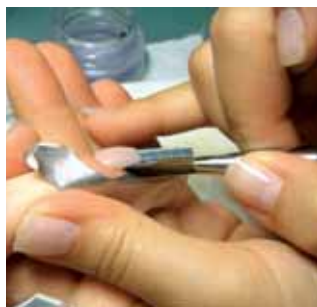
6d. nanosimy akryl