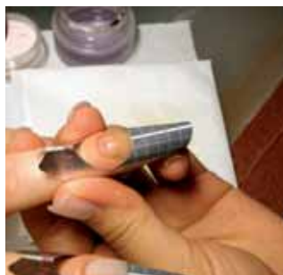
5. dobieramy odpowiedni szablon