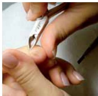
2. usówamy skórki