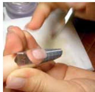
6c. nanosimy akryl