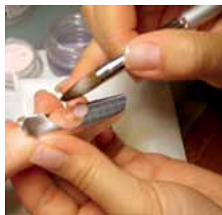
6a. nanosimy akryl