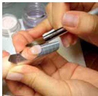
6b. nanosimy akryl