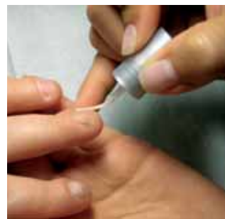
4. odtuszczamy i wytrawiamy płytkę paznokcia