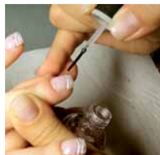
11. nanosimy lakier bezbarwny

sywanego zabiegu. Zalet, jakie nam daje „akryl maskujący”, jest nieskończenie wiele. Jedną z nich jest jego kolor, który do złudzenia przypomina kolor naturalnej płytki paznokcia. To proszek, który doskonale maskuje wszelkiego rodzaju przebarwienia, stąd też jego nazwa „akryl maskujący”. W przypadku jego braku z powodzeniem możemy użyć proszku przezroczystego, „crystal”. Różnica pomiędzy proszkiem przezroczystym, a maskującym jest jedna – w przypadku pierwszego widać, co jest pod spodem.