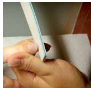
8. opiłowujemy paznokcie