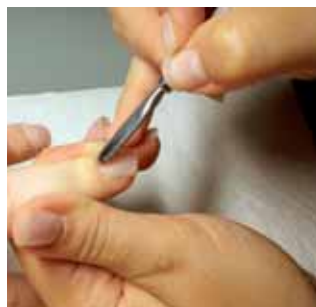
7. odpychamy skórki przed piłowaniem